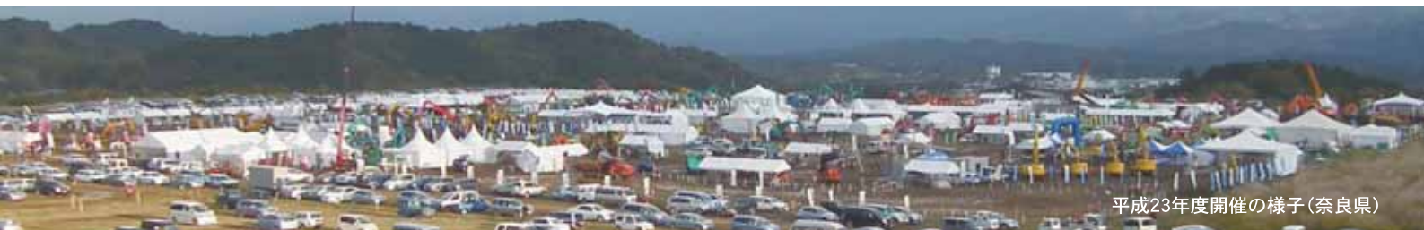
平成23年度開催の様子(奈良県)