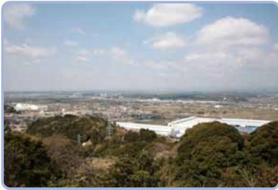
みはらしの丘からの袋井市内の眺め