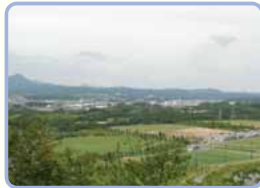
みはらしの丘からの掛川市内の眺め