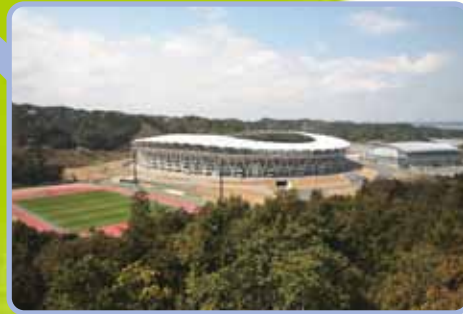
エコパの丘からの眺め